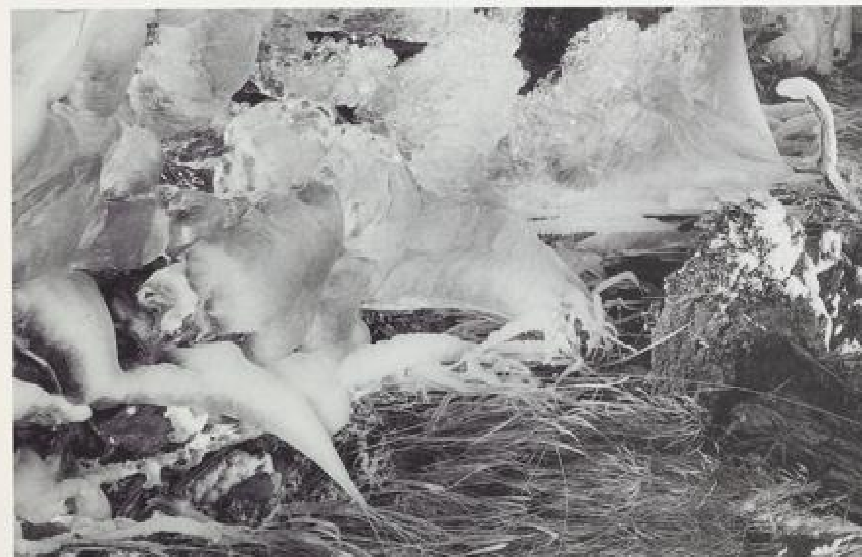
Der Mensch muß erst wieder die Schönheit und den Wert der Natur entdecken.

Nach außen verzichten kann nur der Mensch, der einen inneren Reichtum besitzt. Darum genügt nicht der moralische Appell, auch nicht der zum Schutz der Umwelt. Wenn einer als Kind oder Jugendlicher gemütsierte Erlebnisse hat, dann weiß er, daß es nicht eines Aufwandes bedarf, um glücklich zu sein. Wenn bei einem Menschen eine erlebnishafte schöpferische Eigeninitiative da ist, mit jenen Erlebnissen, die zwar etwas Mühe kosten, aber eben auch Freude bringen, ob im musikalischen, sportlichen, sozialen oder beruflich-bildungsmäßigen Bereich, dann braucht man nicht so viel, wie wenn man nur in dieser dümmlich-passiven Konsummentalität von Glotze, Disco und Kilometerfresserei steht. Ich bin mit 1200 jungen Menschen in 60 Alpinkursen