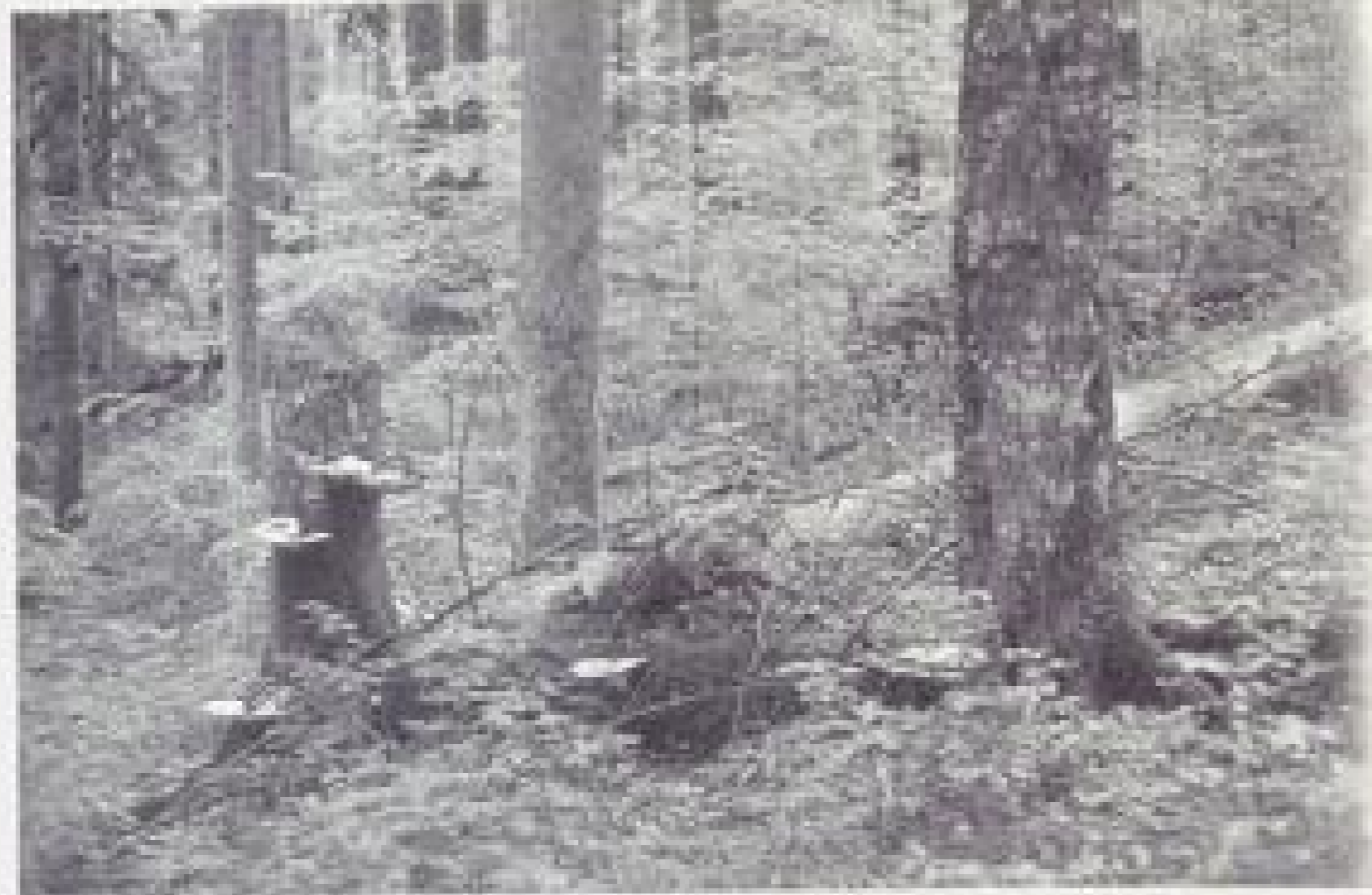
Der Mensch darf nicht die ganze Natur unter sein Joch zwingen und muß ausreichend Flächen für die ungestörte Entwicklung der Ökosysteme belassen.

Hier sehe ich eigentlich viele eingespannt. Mir ist die Schule eine vertraute Welt, von der erkranklichen Volksschule bis zur Universität habe ich an allen Schultypen unterrichtet, und ich habe im Herbst als Bischof die tausendste Pflichtschulklasse besucht. In diesem Punkt geschieht mehr als in meinen Zeiten. Hier muß ich auch das Fernsehen loben, das mit den großartigen Naturfilmen wirklich das Wunder der Schöpfung erschließt und zu neuer Wertsicht beiträgt. Was in meiner Kindheit eine „Drecklacke“ war, ist heute ein „Botop“. Und unverhältnismäßig seltener begegnet man den Bergblumenrupfern. Einfluß in diese Richtung nehmen die Lehrpläne, in meinem bischöflichen Gymnasium ist Umwelt und die Information über die Lösungsmöglichkeiten, die sachlich vertretbar sind, zum Schwerpunkt der Schule gemacht worden. Das heißt aber auch, daß Literaturunterricht, Religionsunterricht, bildende Kunst und Musik, Geographie und außerschulische Initiativen in diese Richtung gepiekt werden. Und es hat sich gezeigt, daß bei den jungen Menschen für eine derart ganzheitliche Sicht der Dinge großes Interesse besteht.