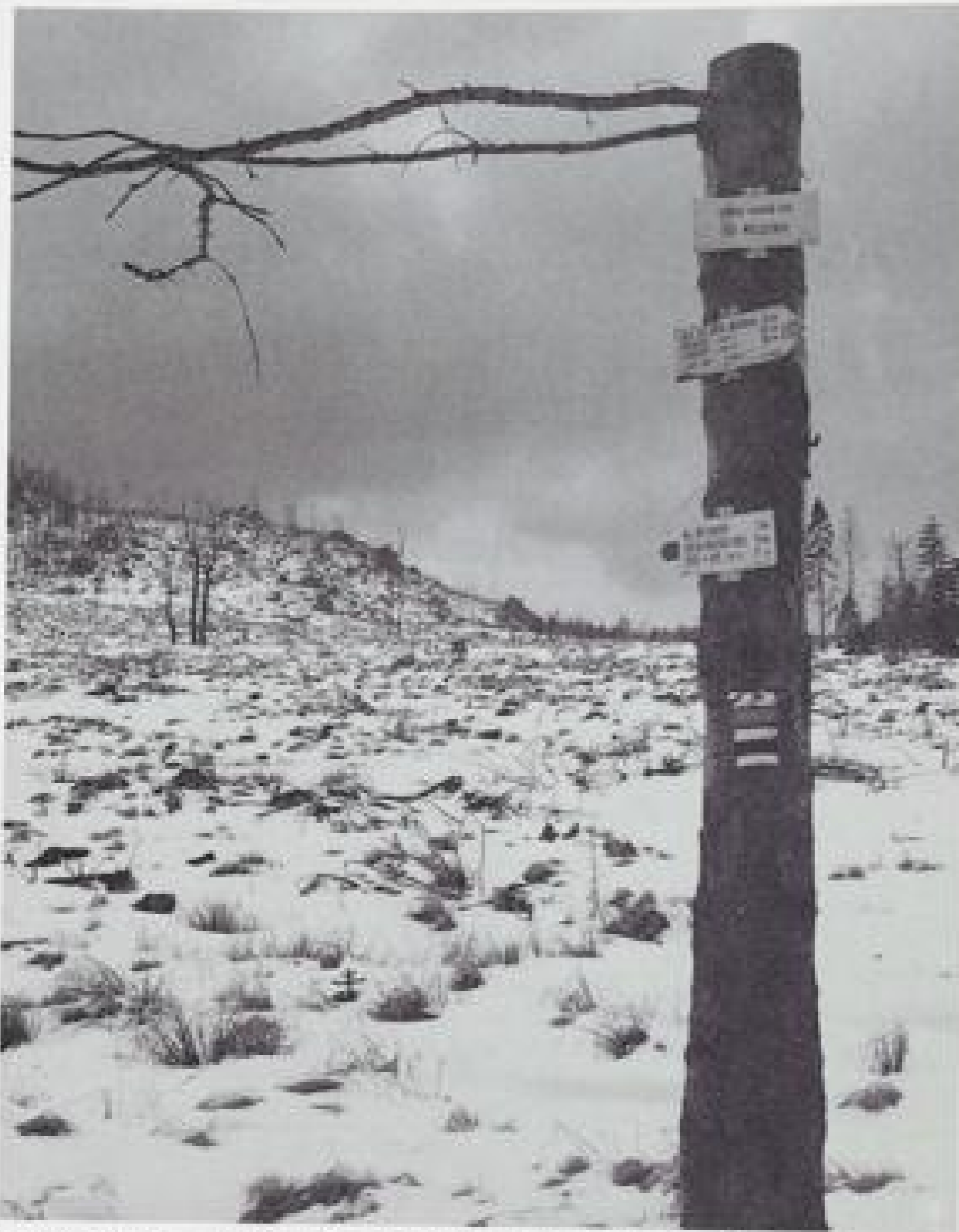
Die zerschneidende Hand des Menschen bedroht die Natur. Waldsterben im Erzgebirge

biemen über Wildbachverbauung und Lawinerschutz zur Hege und Nutzung des Waldes. Und in dem Wort „Bebauen und Behüten“ steckt auch schon die ganze Spannung dieser Aufgabe, die Spannung, die in unserer Epoche massiv aufgebrochen ist.