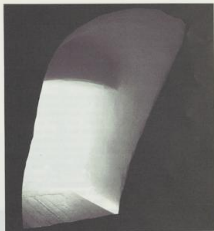
Aus dem Dunkel heraus, in das Licht gehen.

Vielleicht denken Sie daran, wenn Sie im Vorbeigehen einen Blick auf ein Kreuz werfen. Am Weg, auf dem Kirchturm, an der Kapellenwand, auf dem Altar. Auf dem Berg, am Waldrand oder im Wohnzimmer. Vielleicht denken Sie daran, wenn Ihre Hand nach dem Rosenkranz tastet und Sie an seinem Beginn das kleine Kreuz fühlen. Vielleicht denken Sie daran, wenn Sie das kleine