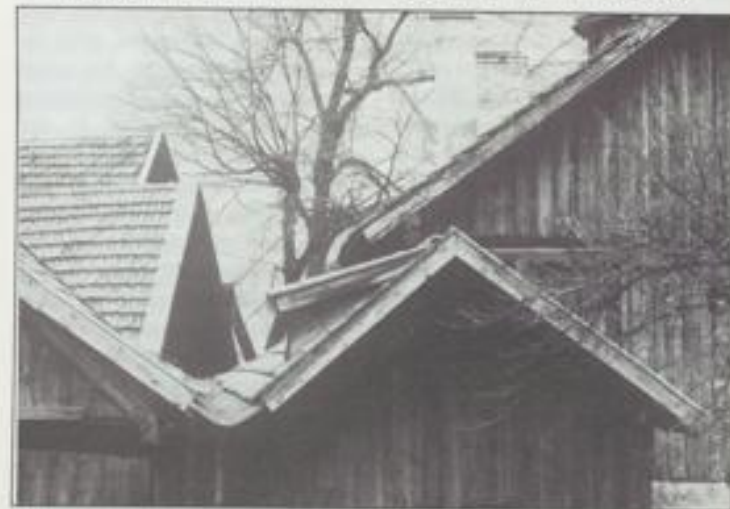
Sterben, das ist ein Nach-Hause-Gehen.

Der Gedanke an den Tod kann dieses Erfahren von Heimatlosigkeit verstärken. Ist er nicht die letzte, große Einsamkeit? Bleiben sie nicht alle zurück? Der fürsorglichste Arzt, der alles versucht, die beste Pflegerin, der verständnisvollste Seelsorger, der liebste Mensch, der mir die Hand gehalten hat. Bleiben sie nicht alle zurück? Versinken nicht ihre Stimmen und Gesten, ihre Worte und Bemühungen und Berührungen? Gar nicht daran zu denken, bei wie vielen Menschen heute das Sterben sowie so keine besonders humane Begleitung hat. Aber wenn auch, schlußendlich ist ja doch das große Alleinsein da. Die völlige, tiefste Fremdheit in der Welt.