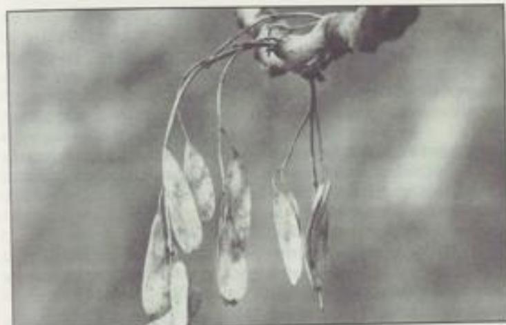
Ein wenig sterben, um neues Leben zu gewinnen!