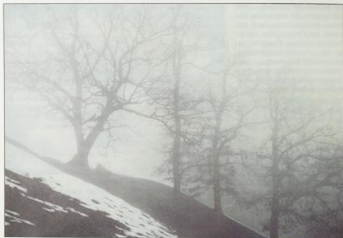
«Herbst ist nur, weil sich Frühling vorbereitet.» (Hans Urs von Balthasar)