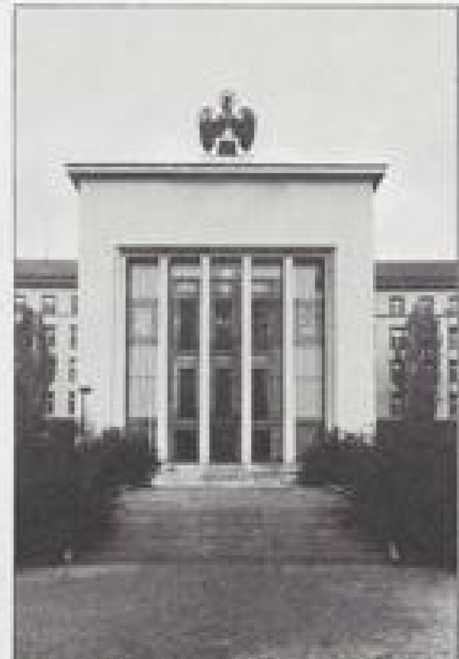
Denkmal für Österreichs Freiheitskämpfer zwischen 1938 und 1945

„Die Hebräer wurden wieder frech“, schrieben die „Innsbrucker Nachrichten“ vom 11. November 1938. Der junge Jude Herschel Grünspan hatte den Legationsrat von Rath in Paris erschossen.