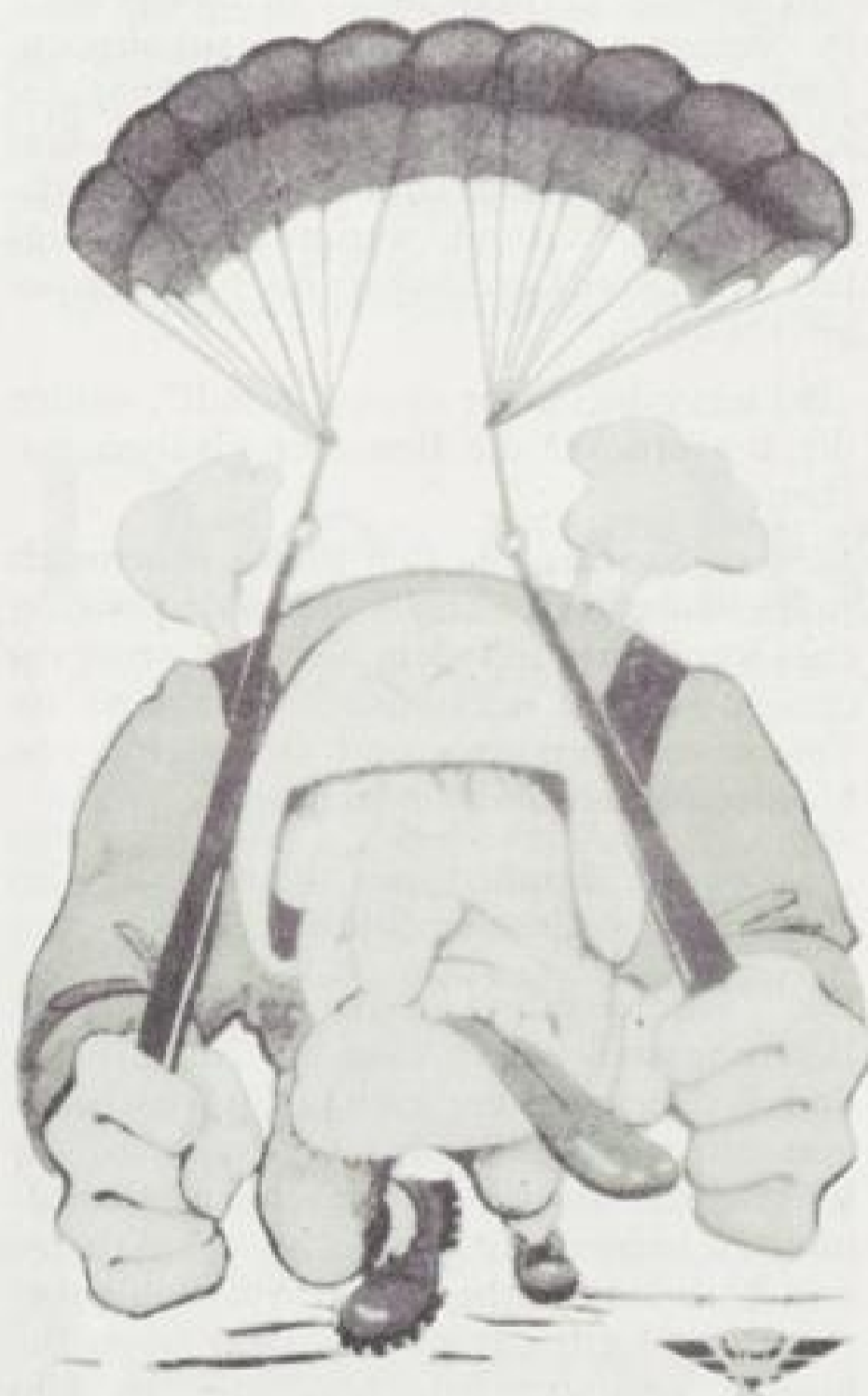
Paragleiter haben Mut – auch zur Selbstironie