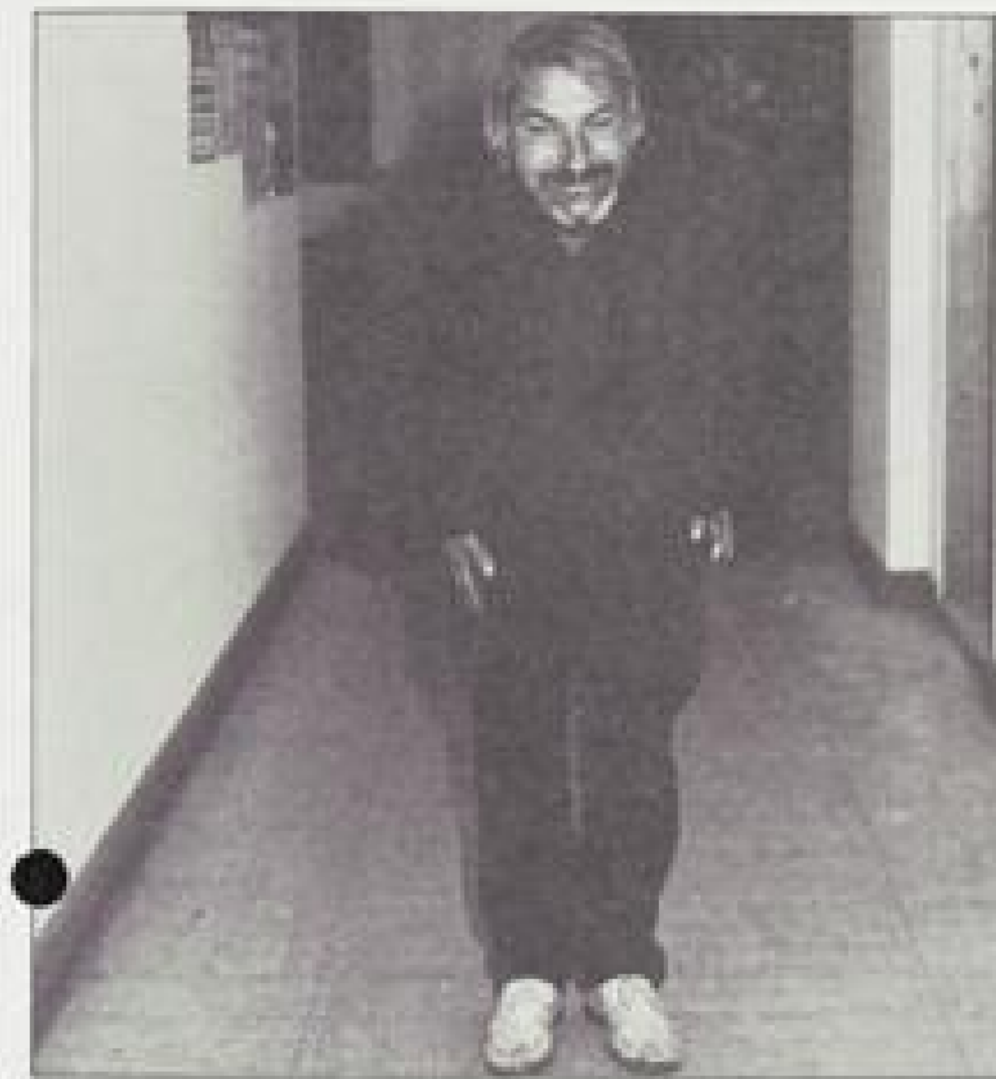
Würden Sie diesem Mann ein Zimmer geben?