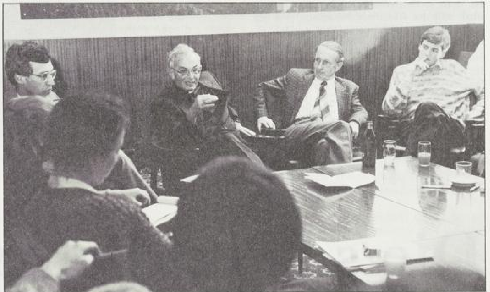
Bischof Stecher hielt seine Zuhörer drei Stunden lang in Atem.