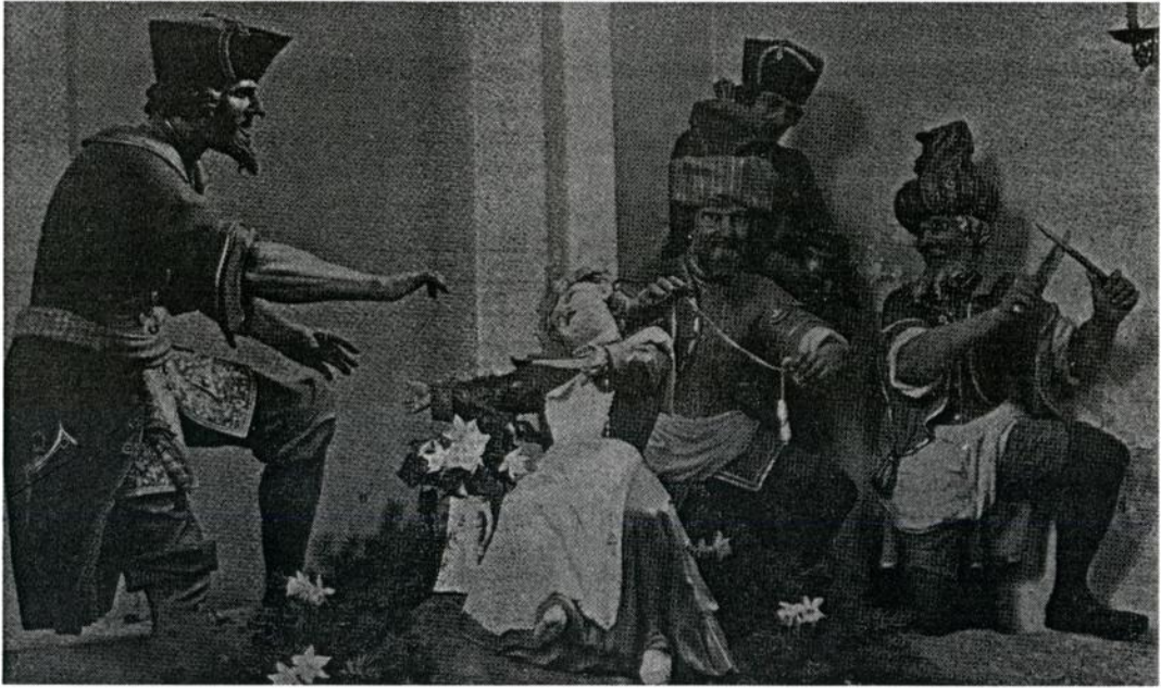
Darstellung der Marter des Andreas von Rinn, ehemals in der Wallfahrtskirche von Judenstein