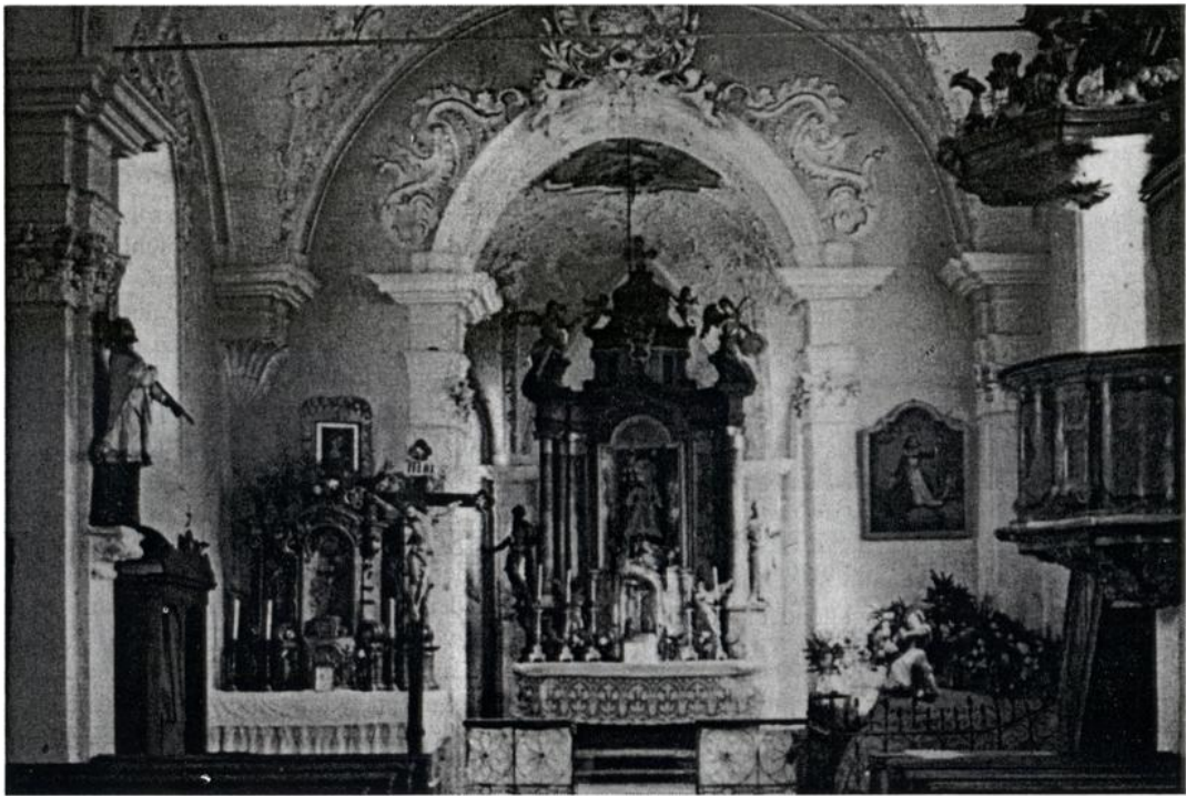
Wallfahrtskirche von Judenstein bei Rinn (vor der Umgestaltung von 1989)