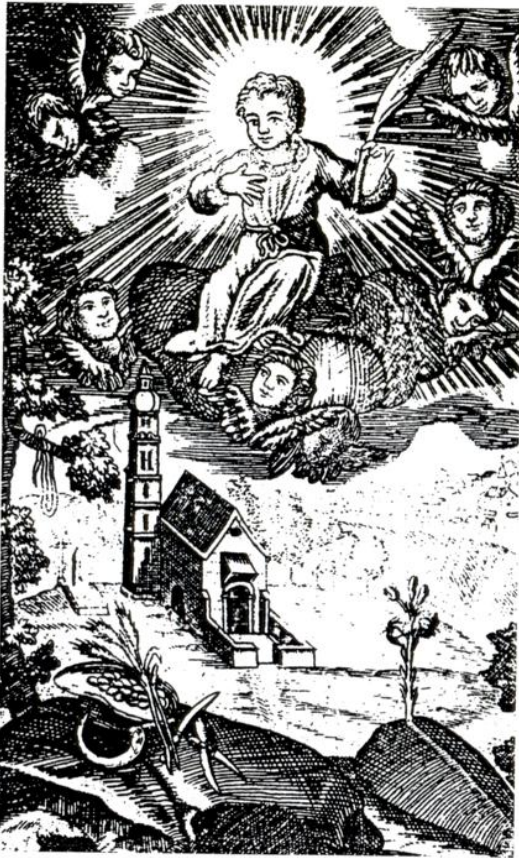
Andreas von Rinn

nun wendeten die Hebräer ihre Augen scheu herum . . . Dann . . . wanderten sie eilends weiter.“ 21