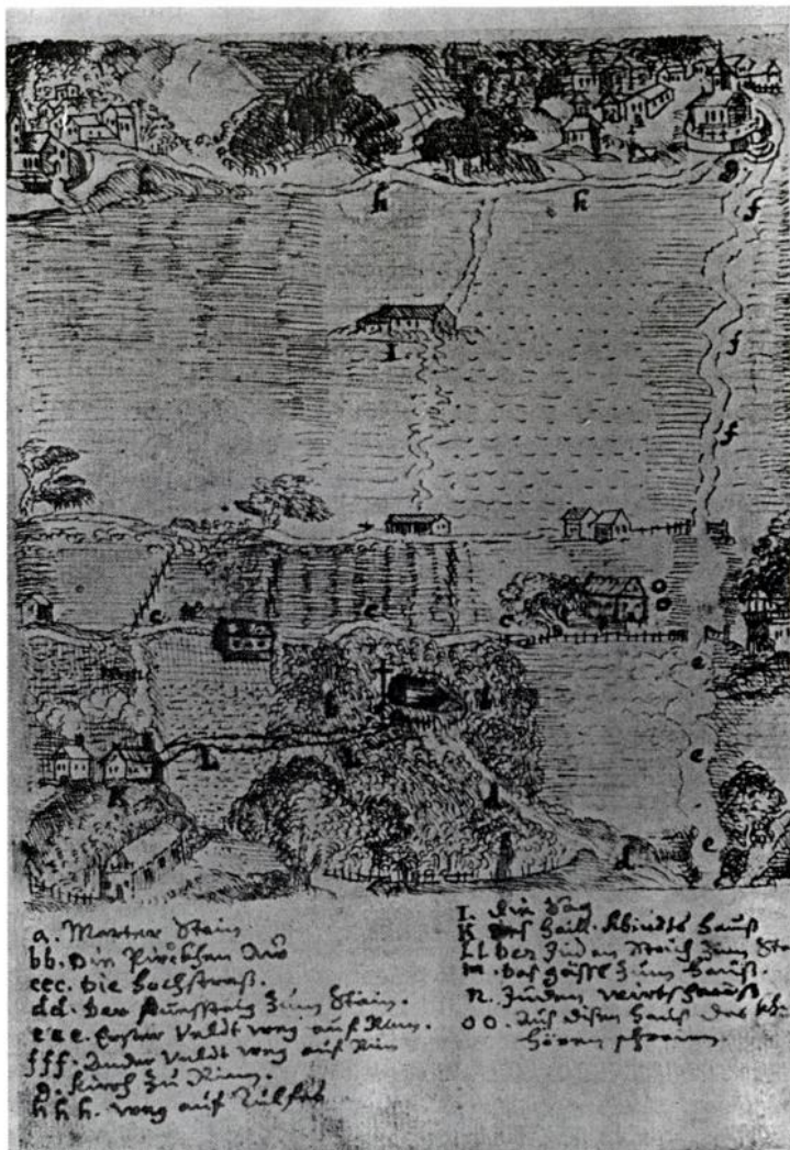
Situationsplan von Judenstein (a) mit den nahen Dörfern Rinn (g) und Tulfes (h). Federzeichnung von Dr. Hippolytus Guarinoni in dessen Buch „Kurzer Bericht von dem unschuldigen Khindl zu Rinn“, pag. 27, Handschrift Nr. 38 A im Stiftsarchiv Wilten.

„Da droben hängt der Betrüger!“ so begann nun der Rothbart zu sprechen. „Er blickt höhnisch auf uns herab . . . Unsere Väter habe ihn mit Recht getödtet und doch steht sein Bild heute an allen Orten und Ecken und Winkeln der Welt und predigt in einemfort unsere Schande. Wir glauben, ihn zu besiegen und für ewig in Schmach zu begraben. Leider hat er aber mit seinen verfluchten Anhängern uns besiegt und wir sind nun schon beinahe anderthalb Jahrtausende als Flüchtlinge und Heimatlose in der ganzen Welt zerstreut und von allen Völkern des Erdkreises gehaßt und verachtet. Ja, Du Verruchter da oben am Kreuze – Du läßt uns keine Ruhe und Deine Weherufe verfolgen uns überallhin . . . Ewig glüht der Haß in unserer Brust gegen Dich und Deine Anhänger. Ja, lache nur spöttisch zu uns vom Kreuze herab! Zimmermannssohn, noch hast Du nicht zu Ende gesiegt! So lange wir leben, werden wir die Deinen bis auf den Tod verfolgen. Heute soll nun eines der Deinen als unser Opfer fallen – eines Deiner Röslein, so zart und schön, wir wollen es zertreten und vernichten, wie unsere Väter es an Dir einstens gethan haben. Keine gesunde Faser soll mehr an unserem Opfer bleiben!“