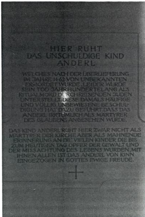
Gedenktafel in der Wallfahrtskirche von Judenstein (1989)